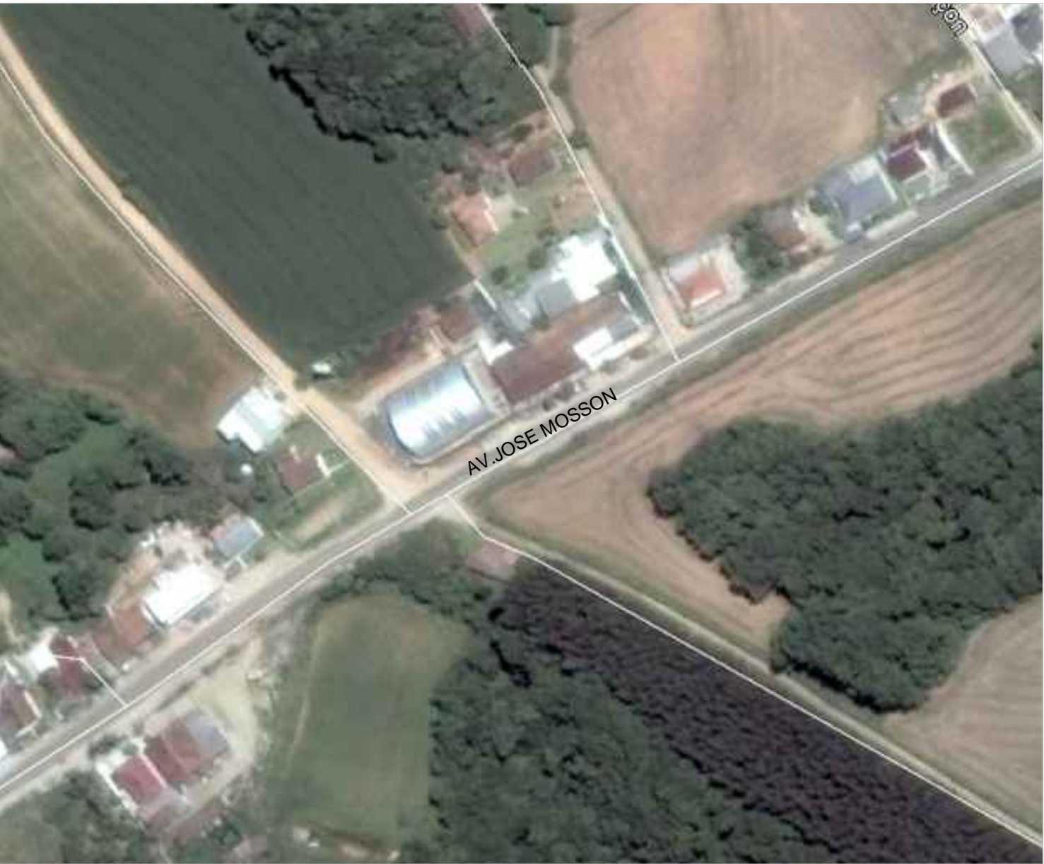
SITUAÇÃO ESCALA: 1/SEM ESCALA ÁREA: .